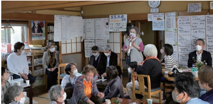
手作りマイクを片手に、全員が一言メッセージを話した

28日は非常に多くの人が訪れ、台所は大変だったとのこと。その様子を見ていた方が、最終日も多くの人が食事をする可能性があるため、具だくさんの味噌汁より、カレーのほうが対応しやすいのではないかと提案。この提案に対して、「私たちは、利便性ではなく、来られる方を大切にして運営してきた。カレーばかりになるから、最後は懐かしいお味噌汁にしよう」と話し合った、その時の気持ちを大切にしたい」「何のためにやってたのかという原点に戻ってやらないと、そんな場所には誰も来なくなる」という話し合いがなされ、最終日は具だくさんの味噌汁とされました。