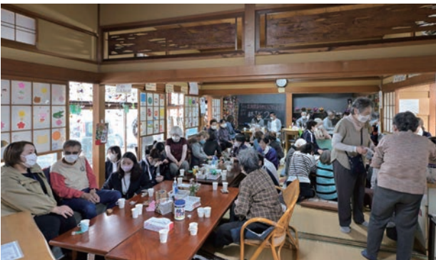
「外回り」の席から茶の間を見る

そこで、「どなたが来られても『あの人だれ!!』という目をしない」ことが大切な約束事として掲示されています。ただし、自分では「あの人だれ!!」という目をしたと思っていなくても、訪れた人が「あの人だれ!!」という目で見られたと思う場合がある。茶の間の戸を開ける時の心理的なバリアは、そこまで大きなものだという事です。そこで、「戸を開けたとき、視線が集中しない配置にする」「会議風の口の字はさけて、5〜6人単位で座れる様に散らばる配慮をする」(河田珪子 2016)などのように、テーブルの配置も配慮されている